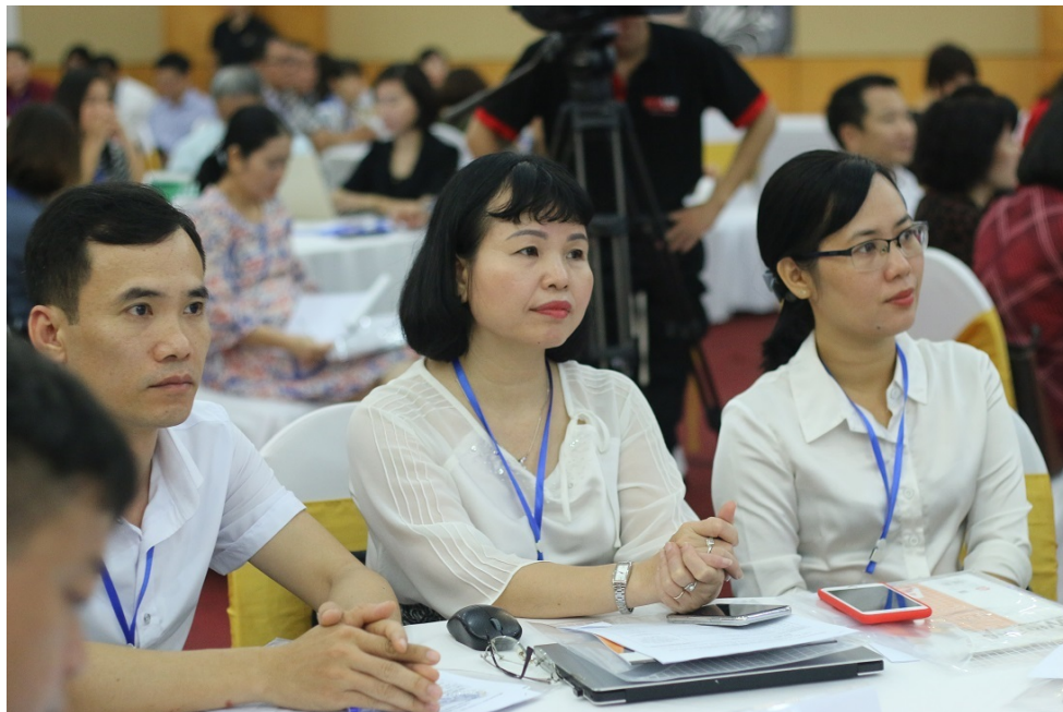
Giáo viên, giảng viên trong một buổi tập huấn cho chương trình phổ thông mới.

Đặc biệt, riêng với giáo viên dạy lớp 6 với SGK mới, thì nhiều ý kiến cho rằng quá cập rập khi năm học mới sắp bắt đầu.