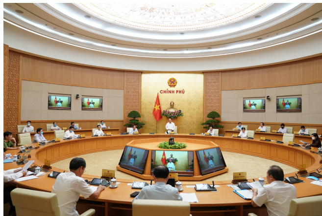
Quang cảnh phiên họp.

Thủ tướng nhấn mạnh yêu cầu giảm tỉ trọng chi thường xuyên, kiểm soát chặt chẽ, hiệu quả vốn đầu tư công; phân cấp ngân sách Nhà nước phù hợp với yêu cầu phát triển đất nước trong tình hình mới. Nội dung báo cáo cần thể hiện rõ chủ trương, giải pháp huy động các nguồn lực xã hội, đặc biệt là nguồn vốn đầu tư nước ngoài (FDI) để đóng góp vào phục hồi phát triển KT-XH.