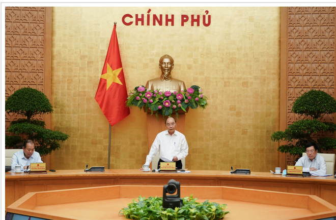
Thủ tướng chủ trì phiên họp Thường trực Chính phủ chiều 19/8.

(Chinhphu.vn) - Ngày 19/8, Thủ tướng Nguyễn Xuân Phúc chủ trì cuộc họp Thường trực Chính phủ về những nội dung chủ yếu của dự thảo Kế hoạch phát triển KT-XH và dự toán NSNN 2021, dự thảo Kế hoạch tài chính-NSNN 2021-2023, dự thảo Kế hoạch phát triển KT-XH và Kế hoạch đầu tư công trung hạn 5 năm 2021-2025.