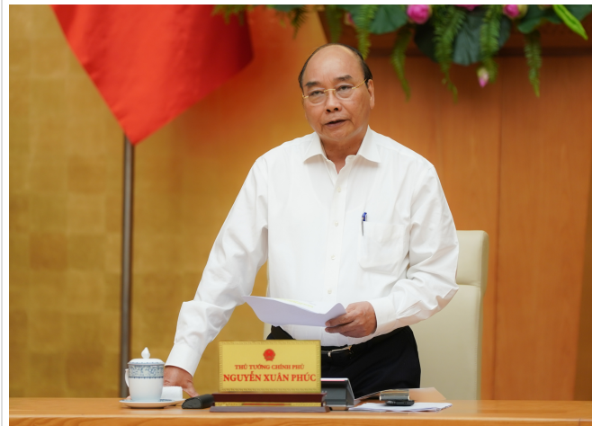
Phát biểu tại phiên họp, Thủ tướng yêu cầu các Bộ trưởng, thành viên Chính phủ thấm nhuần tinh thần chủ động, tích cực, nỗ lực vượt khó.

Các nước trên thế giới đều có các biện pháp giảm thiểu tác động nghiêm trọng của COVID-19, nhất là hỗ trợ người dân, doanh nghiệp gặp khó khăn. Các gói hỗ trợ của các nước đều rất lớn. Chính phủ, Thủ tướng Chính phủ nhiều lần chỉ đạo yêu cầu các bộ, ngành, đặc biệt là Bộ Tài chính, Bộ Kế hoạch và Đầu tư, Bộ LĐ-TB&XH, các địa phương phải tập trung nghiên cứu các giải pháp hỗ trợ kịp thời đủ mạnh đối với người dân, doanh nghiệp đang gặp khó khăn hiện nay.